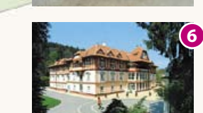
V Hoře nalevo